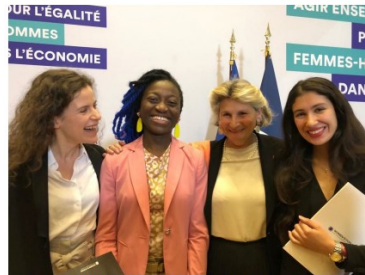
Remise par les Ambassadrices d'un rapport sur la mixité dans les STEM à Bercy, en partenariat avec le Women's Forum.

AMBASSADRICES : programme qui lutte contre la désaffection et le décrochage des femmes dans le secteur numérique → Accompagnement individuel et collectif sur le temps long